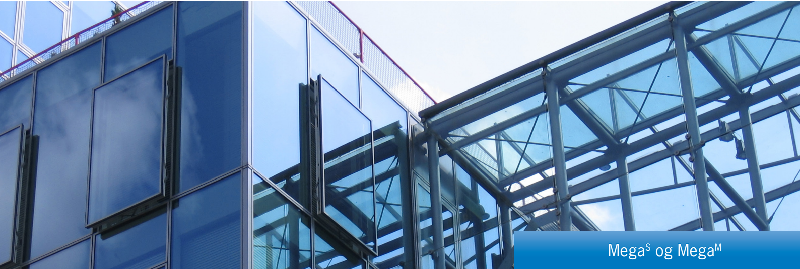
Mega S og Mega M