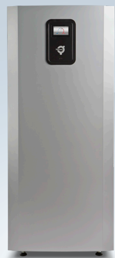
Mega L og Mega XL

A+++ energiklasse når varmepumpen er en del af et integreret system A+++ energiklasse for varmepumpen alene. Energiklasser i overensstemmelse med Eco-design direktiv 811/2013